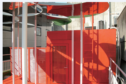
南洋堂ルーフラウンジ